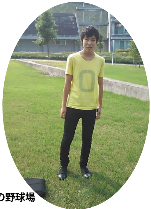
本庄高等学院、総天然芝の野球場

僕の通う学校は埼玉の山の中に建っているという珍しい学校なのだが、その上野球場なんかは総天然芝ときている。そんな森に囲まれ天然芝の広がるグラウンドでソフトボールをしていると、 何かこうとても幸せな気持ちになる 。普段は暑くて嫌だなど思うに過ぎない太陽が輝いて見え、蒸した草の匂いに幼き頃の夏、静岡の山家で、鳥取の天間で過ごした日々を思い出す。そしてそんな時(ああ生きてるんだなあ)と実感するのだ。